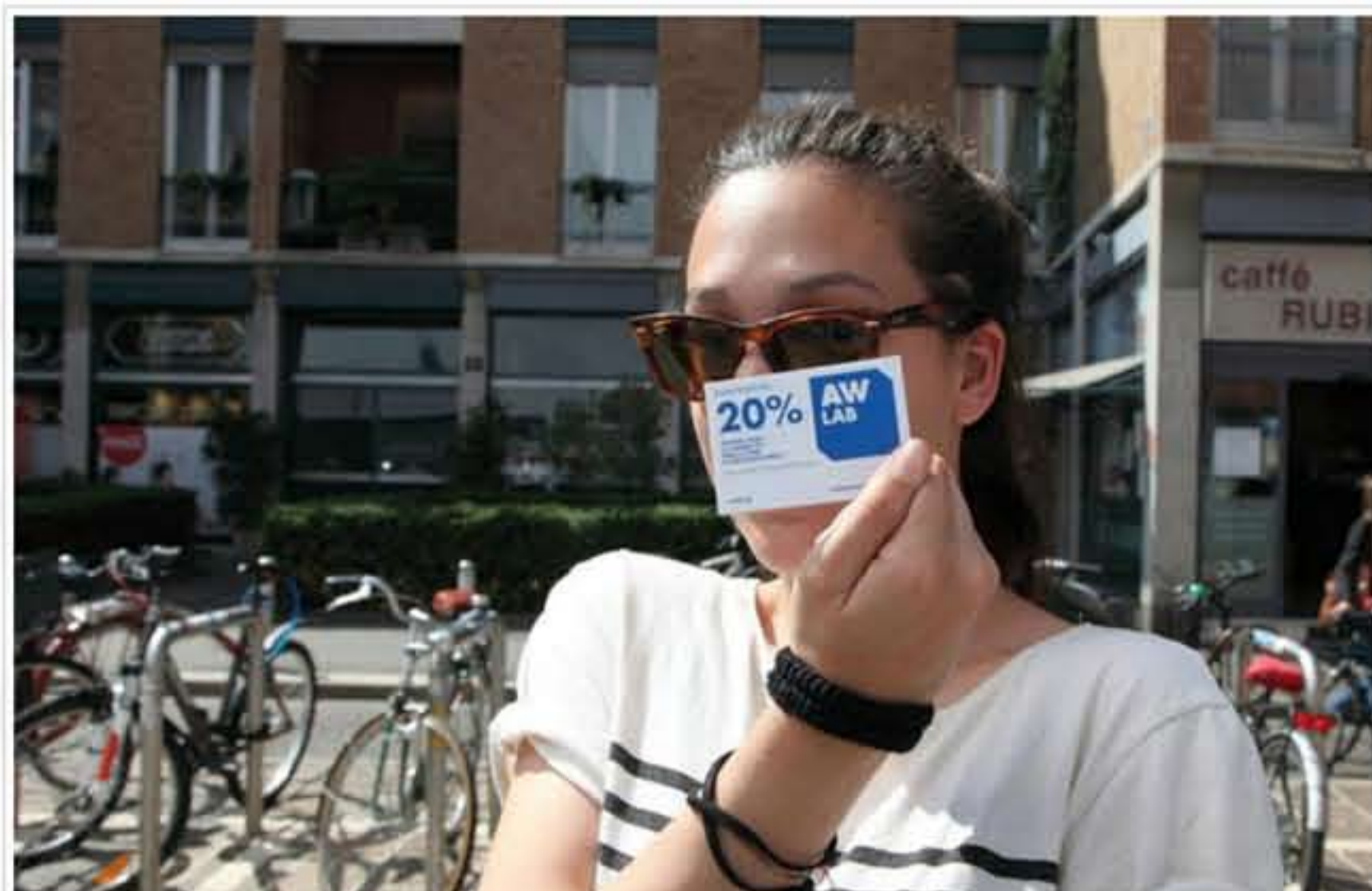
RIPARTE "AW LAB ON TOUR"

Dal 5 al 7 maggio arriva a Roma lo "Style VAN" di AW LAB carico dei migliori capi della propria collezione e setaccerà il Belpaese a caccia degli "street style" più originali, dando ai ragazzi selezionati la possibilità di mixare il loro look con i prodotti AW LAB.